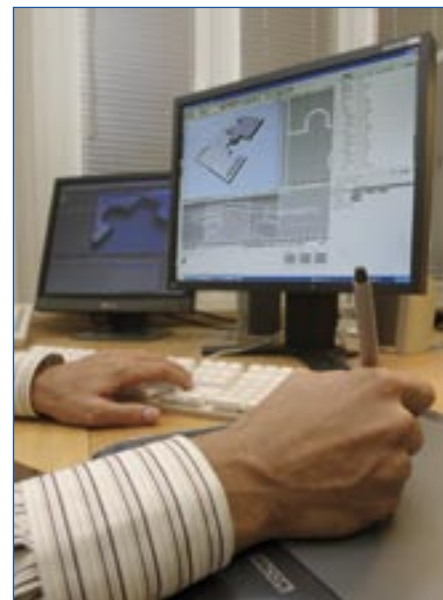
Von Handwerk bis Highend: Das Team von vE&K beherrscht alle Disziplinen vom klassischen Scribble bis zur Entwicklung von 3D-Animationen